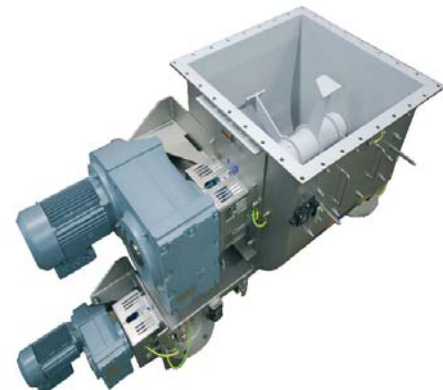
Bufferen, homogeniseren en uitdoseren van aangroeiende producten