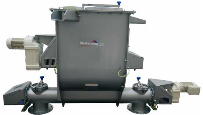
Hopper 1000 liter met doseerschroef. Doseerschroef links en rechts doserend

Veel industrieën gebruiken de woelbunkers van Klinkenberg. Denk bijvoorbeeld aan de voeding-, chemie, farmacie, veevoeder- en slibindustrieën.