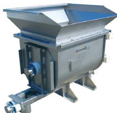
Woelhopper met zakkenstort voor het lossen van additieven in de snoepindustrie