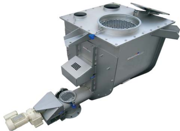
1500 liter hopper met doseerschroef links of rechts doserend