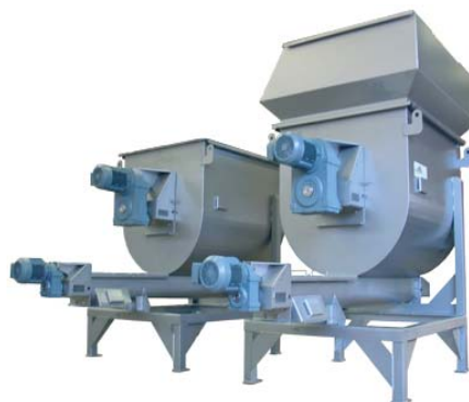
Doseren van suiker cacao en zetmeel volledig sanitair uitgevoerd