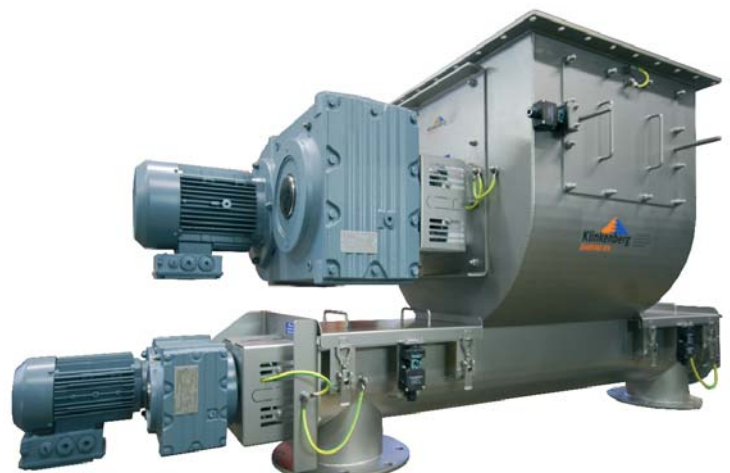
Woelbunker ingezet in een uitwendige Zone 22 en een inwendige Zone 20 (TUV gecertificeerd)